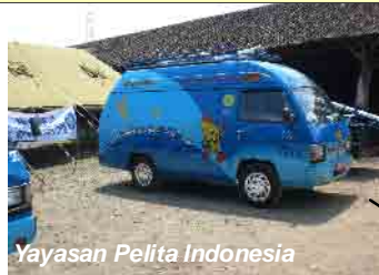
Yayasan Pelita Indonesia

Yayasan Pelita Indonesia CP : Kapten Wayan (085218534822) Ketersediaan makanan pokok, 360 paket, selimut masih kurang, tenda dan tikar. Jumlah pengungsi 170 (di lokasi pengungsian), di luar itu: 391 KK dan ditargetkan 1000 KK