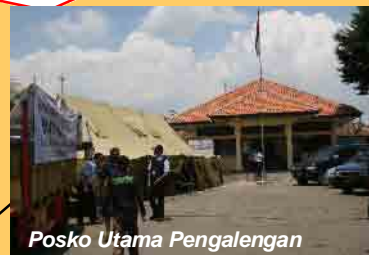
Posko Utama Pengalengan

PUSKESMAS Pengalengan dengan kondisi rusak berat